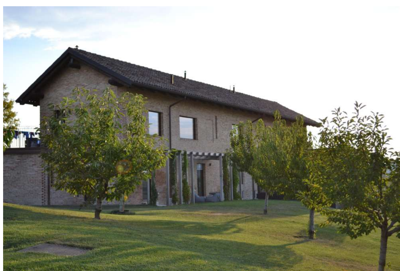
La struttura de "Le Marne", resort esclusivo immerso nel verde dei vigneti piemontesi

Il Monferrato è uno dei territori più spettacolari e gettonati da turisti sia italiani che stranieri e settimana scorsa, in occasione del primo raduno della Nazionale ciclocross di Pontoni, abbiamo avuto il piacere di passare due giornate tra le colline dell'Astigiano nel meraviglioso Relais "Le Marne" di Costigliole d'Asti.