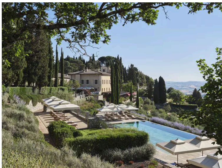
Rosewood Castiglion del Bosco, in Val d'Orcia

Forbici e trattori si muovono febbrilmente tra i filari: la vendemmia è cominciata in molte regioni vinicole italiane, dall'Alta Langa alle Marche, alla Sicilia, la più precoce di tutte che ha dato il via alla raccolta a fine luglio, complici grande caldo e siccità. È questa la stagione preferita dagli enoturisti, consapevoli di trovare accoglienza nelle cantine ben oltre il tempo di un tour guidato. Esperienze immersive, en plein air specialmente, rari contesti architettonici e artistici e cucine di qualità: i wine resort sono una delle declinazioni più attraenti del mondo dell'hôtellerie.