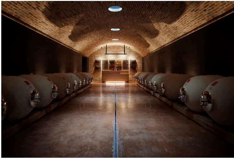
La cantina di Mura Mura, nelle Langhe