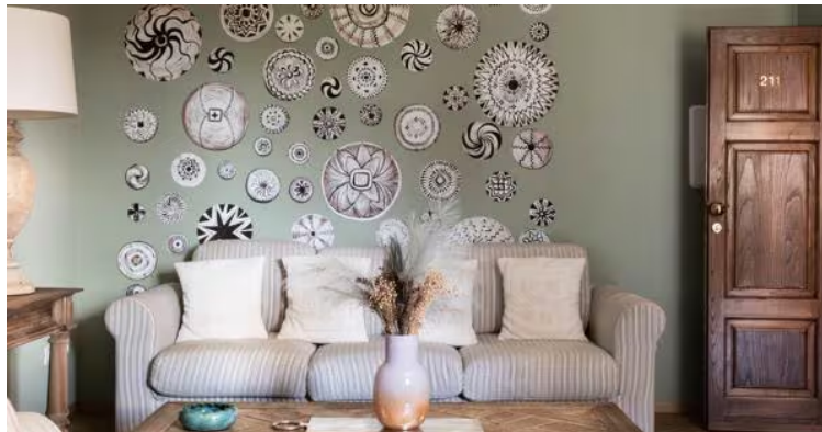
Un interno di Casa Villamarina, nelle tenute Sella e Mosca ad Alghero

Il savoir-faire della famiglia Moretti nel settore dell'ospitalità enoturistica – ampiamente dimostrato all'Albereta, in Franciacorta, e all'Andana, in Maremma – si svela da un anno anche in Sardegna con Casa Villamarina, una dimora con camere dai colori pastello circondata dai 520 ettari di vigneto di Sella e Mosca, la cantina ad Alghero simbolo della viticoltura sarda, dal 2016 di proprietà del gruppo fondato da Vittorio Moretti. Con le atmosfere di inizio secolo, il museo storico e la piccola chiesa dedicata alla Madonna dell'Uva, questo placido borgo è il luogo ideale per i cultori dello slow living.