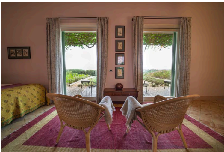
La Foresteria, wine resort di Planeta a Menfi (Ag)