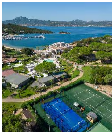
Una vista dall'alto del 7Pines Resort a Baja Sardinia.