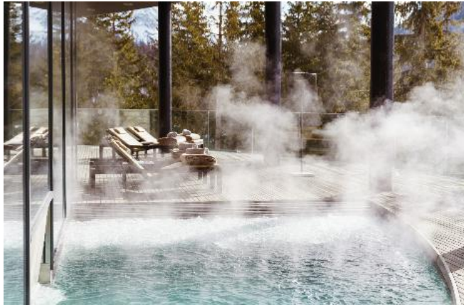
La spa del Carlton Hotel di St. Moritz.