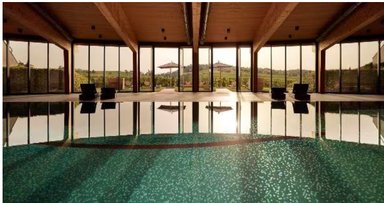
La vista dalla piscina al Relais Le Marne.