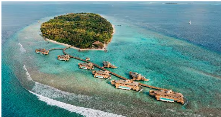
Il Soneva Fushi.