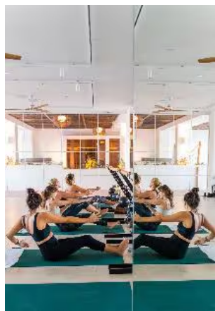
Un allenamento allo ZEL Mallorca.

Difficile immaginarli fuori dal campo nelle vesti di manager, alle prese con business plan, strategie e previsioni di fatturato. Ma se campioni come Rafael Nadal o Andy Murray hanno intrapreso la strada dell'imprenditoria, c'è da giurarci che l'abbiano fatto con il mix di disciplina e resilienza del loro impegno agonistico. Ad aprire la strada è stato proprio Murray, l'ex campione olimpico e degli US Open , due volte vincitore di Wimbledon , che ha acquistato Cromlix House, maniero vittoriano nella campagna scozzese, vicino a Dunblane, sua città natale, e l'ha trasformato in hotel. Che l'abbia fatto per un investimento, per differenziare l'attività in previsione del futuro, per ritornare nei luoghi cari o «per aiutare la comunità locale, attirando visitatori e creando nuovi posti di lavoro», come ha dichiarato, sono parecchi gli sportivi sedotti dal business dell'hôtellerie.